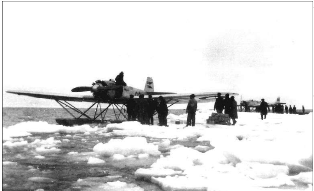
Flyvevåbnets Historiske Samling

Den danske Marines vandflyvere oprettede en postrute til Anholt, men da vinteren fortsatte med uformindsket kraft, dukkede behovet for livsvigtige ting som fødevarer og medicin op.