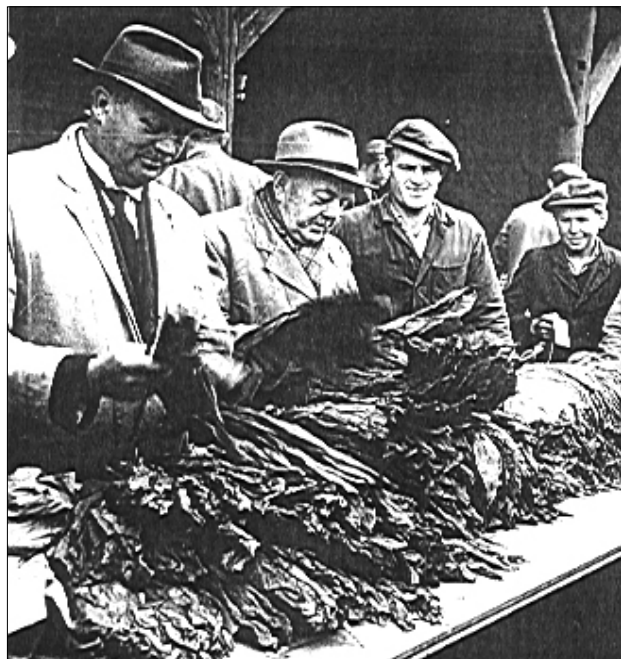
Tobaksblade undersøges inden det går løs på auktionen i Odense.

Derfor blev det nødvendigt at vende bladene med jævne mellemrum. Ribberne skulle fjernes fra de tørrede blade, som derefter skulle skæres ud, alt efter om de skulle anvendes til cigaretter – pibetobak, cerutter eller cigarer. Tobak til cigaretter blev skåret i fine strimler, men den danske tobak havde tilbøjelighed til at smuldre, hvilket absolut ikke forhøjede nydelsen.