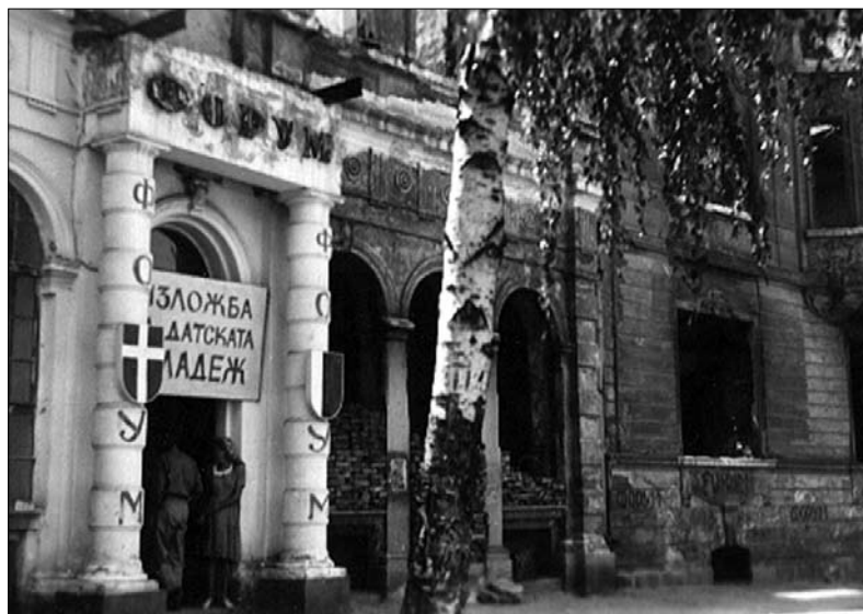
Indgangen til den danske udstilling i Sofia.